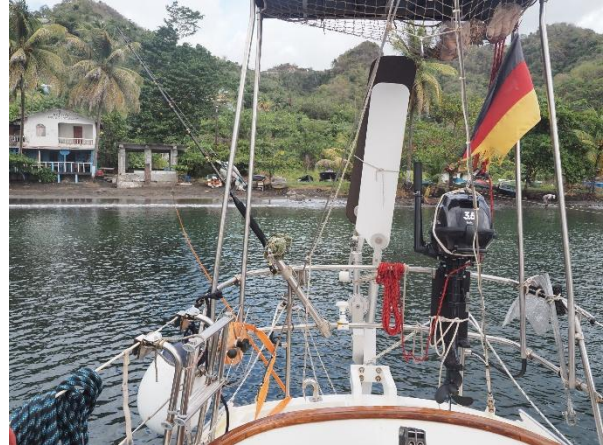
...liegt man vor Buganker und Heckleine an Land

Um die für einen Tagestrip recht weite Strecke zur Rodney Bay Marina im Norden von St. Lucia noch bei Tageslicht zu schaffen, laufen wir kurz nach 6 Uhr aus. Der St. Vincent Channel beschert uns bei dem kräftigen ONO-Wind eine kurze und steile See. Dazu kommt ein kräftiger West setzender Strom, der unseren Kurs über Grund 20° bis 25° nach Westen ändert. In Lee von St. Lucia ist die See ruhig und der Wind lässt nach. Wir müssen den Motor mithelfen lassen, sonst würden wir erst bei Dunkelheit ankommen.