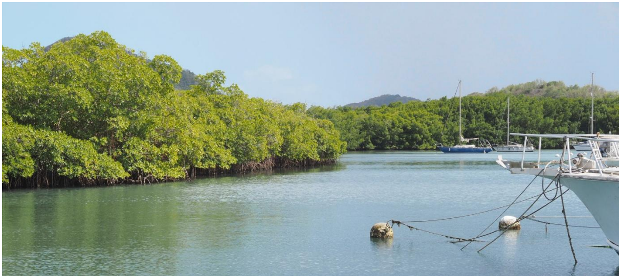
Der Yachthafen von Le Marin grenzt an einen ausgedehnten Mangrovenwald

Wir schaffen es noch bei Tagesslicht bis Le Marin und werden dort von Boat Boys auf unseren vorher reservierten Liegeplatz geführt.