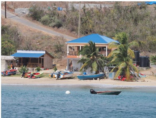
Am Strand der Saline Bay, Mayreau

Wir segeln ein kleines Stück westwärts und ankern in der Saline Bay vor Mayreau. Ein ruhiger Ankerplatz vor der Insel, die bei dem Hurrikan Beryl im Juli 2024 sehr viel Zerstörung erleben musste. Auch heute zeugen noch zerstörte Häuser und die eingestürzte Kirche von der Urgewalt, die sich hier Bahn gebrochen hat und dem Leid, das die Bewohner erdulden mussten.