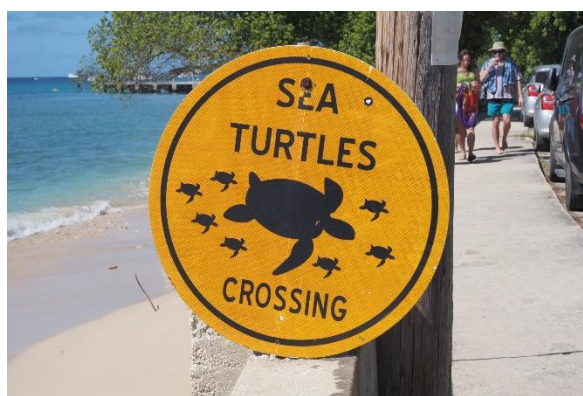
Hier gibt es andere Verkehrsschilder

Den folgenden Tag verbringen wir an Bord mit großflächigem Bekleben des Dinghys, um den Boden einigermaßen wasserdicht zu bekommen. Nach dem ersten Versuch zeigen sich noch einige Lecks, aber es ist zumindest nutzbar.