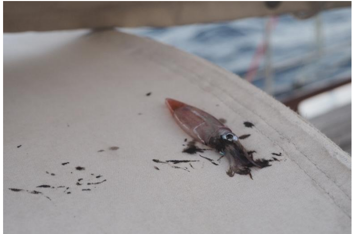
Der Tintenfisch macht seinem Namen Ehre

Dann haben wir ein tierisches Erlebnis der besonderen Art. Wir fahren offenbar durch einen großen Schwarm kleiner Tintenfische, die in ihrer panischen Flucht hoch aus dem Wasser springen und auf dem Aufbau und der Spritzpersenning landen. Eine beachtliche Sprunghöhe für die fingerlangen kleinen Tiere. Natürlich haben alle ihre schwarze Tinte verteilt und die lässt sich vom Stoff der Spritzpersenning kein bisschen entfernen. Nicht einmal etwas verreiben.