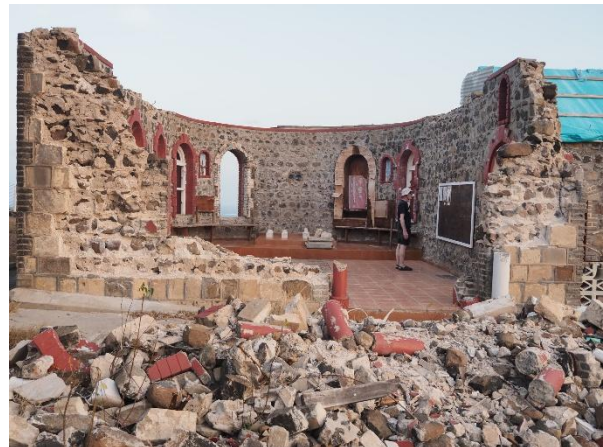
Die Kirche von Mayreau fiel Hurrikan Beryl zum Opfer

Wir machen eine Wanderung entlang des Turtle Trails, der zwar nichts mit Schildkröten zu tun hat – zumindest in dieser Jahreszeit – uns aber um die gesamte Insel führt.