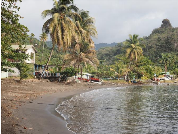
In der Cumberland Bay, St. Vincent....