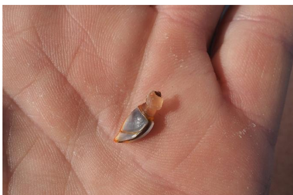
Kleine Entenmuscheln haben sich unter dem Heck angesetzt