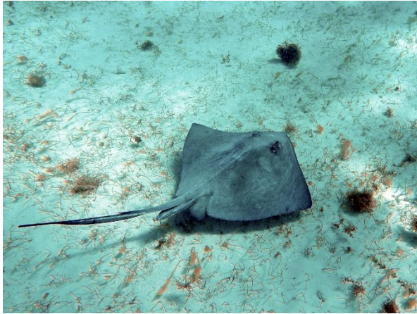
Ein kleiner Rochen

Bequia hat mit seiner niedrigen Bebauung ohne große Hotelklötze seinen Charme bewahrt. Weiter geht es in die Tobago Cays, einer Ansammlung kleiner Inseln und Riffe, dicht südlich von Bequia. Wir ankern im Schutz des Horse Shoe Riffs auf drei Meter kristallklarem Wasser. Ein Schnorchelparadies, wenn auch etwas unruhig durch den kräftigen Ostwind.