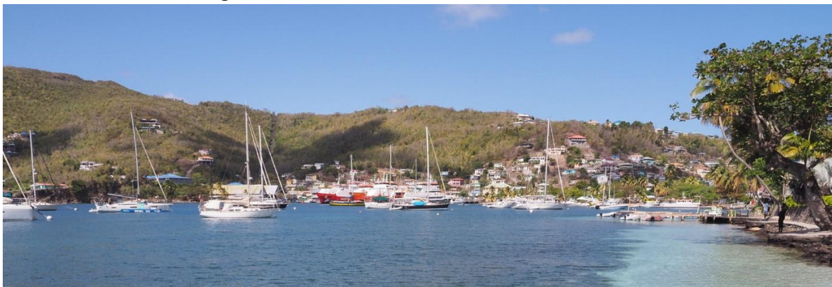
Admiralty Bay, Bequia

In Bequia liegen wir in der Admiralty Bay an einer Mooringboje dicht am Dinghysteg der Bars Whaleboner und Frangipani, die beide bereits seit vielen Jahrzehnten bestehen. Der Harpoon Saloon, sehr oft frequentiert während meiner Sea Cloud Zeit vor 44 Jahren, wurde zu einem kleine Yachtzentrum umgebaut. Schade.