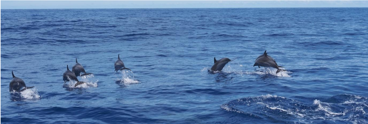
Delfine üben sich im Synchronspringen

Achter Tag auf See: morgens um 02.00 Uhr kommt endlich der (im veralteten Wetterbericht) für früher angekündigte Südwestwind und wir setzen die Genua. Ich halte die Geschwindigkeit auf maximal 4,5kn, da wir ungedrosselt eventuell bereits in der Dunkelheit der kommenden Nacht ankommen würden. Ich laufe in unbekannte Häfen lieber bei Tageslicht ein.