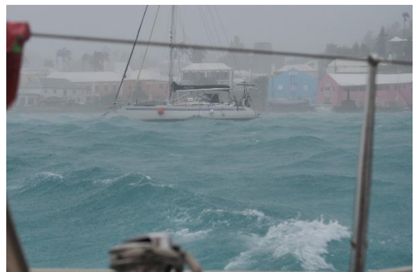
Zwei aufregende Tage und Nächte

Am späteren Nachmittag des zweiten Sturmtages lässt der Wind etwas nach und die Wellenhöhe ist unter einem halben Meter. Stian geht von Bord. Ich kann ihn mit dem Dinghy an Land fahren und absehbar ohne vom Wind umgeworfen zu werden auch wieder zurück an Bord.