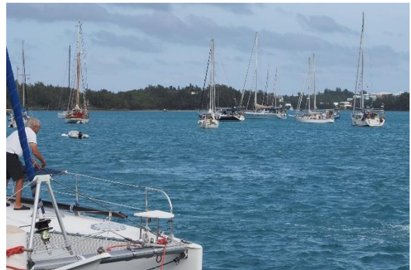
Ankerfeld im St. George's Harbour

Das Einklarieren in St. George's bricht alle Rekorde. Zweieinhalb Stunden warten wir geduldig in der Schlange der angekommenen Segler. Um die Wartezeit zu versüßen beschäftigt man uns mit weiteren Zetteln, die wir mit hinlänglich bekannten Daten füllen sollen. Wenn wir endlich dran sind und ins Büro dürfen, erleben wir ein Musterbeispiel ineffektiver Büroarbeit. Papiere und Pässe werden weitergereicht, kopiert, mit Computerinhalten verglichen, wieder weitergereicht, zwischendurch findet man noch weitere Beschäftigungen. Nach anderthalb Stunden dürfen wir endlich diese Prozedur bezahlen und sind dann tatsächlich fertig. Inzwischen ist es drei Uhr nachmittags und wir hatten noch kein Frühstück. Ab ins nächste Restaurant.