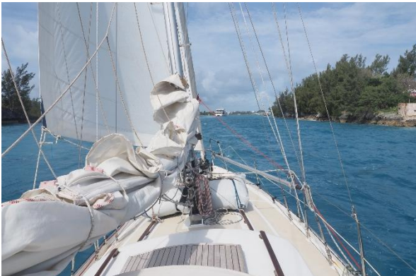
Einfahrt durch den Town Cut

Neunter Tag auf See: morgens weht der Wind aus Nordost, ein Amwindkurs für das letzte Stück. Nur unter Fock segeln wir schließlich westwärts durch den Town Cut in die große allseits geschlossene Bucht von St. George's. Der Anker will sich zunächst in dem harten lehmigen Grund nicht recht eingraben, aber beim vierten Versuch klappt es dann endlich.