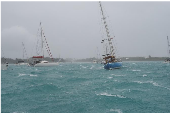
Ankerlieger im St. George's Harbour

Mein Anker hält, ich habe bei 5,5 Meter Wassertiefe 40 Meter Kette gesteckt. Ein Stahlschiff, das langsam auf mich zu driftet, verzieht sich glücklicherweise ans Südende der Bucht.