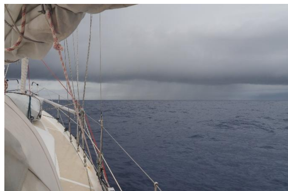
Die Gewitterfront hält Unangenehmes bereit

Sechster Tag auf See: In der Nacht Wetterleuchten und Gewitter in der Umgebung. Gegen Morgen steuern wir direkt auf ein dickes Gewitter in der Gewitterfront zu. Blitze zucken, schwarze Wolken kübeln Wasser in Mengen aus. Ich ändere den Kurs nach Backbord, um es zu umfahren. SY Stella Nova, die auch von St. Martin gestartet ist, liegt 10 Seemeilen vor uns und dreht ebenfalls nach Backbord ab. Wir kommen alle gut dran vorbei.