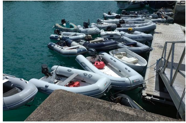
Am Dinghy-Steg darf man auch in dritter Reihe parken

Die ersten Tage vor Anker im St. George's Harbour werden Boote und Ausrüstung einem Härtestest unterzogen. Wir haben zwei Tage und Nächte Sturm, die Wetterstation hat Windspitzen von 57 Knoten gemessen. Die Bilanz der zwei Tage: Fünf Yachten laufen mit zerfetzten Vorsegeln ein, eine weitere muss eingeschleppt werden. Im Ankerfeld slippt der eine oder andere Anker, ein Boot hakt die Kette eines Nachbarbootes mit seinem slippenden Anker, beide kollidieren, sie lösen ihre Kette und erhalten – nun ohne Anker – Hilfe von der Hafenaufsicht, sie bekommen eine Mooringtonne für große Yachten zugewiesen. Und an Land fliegt einem Haus das Dach weg.