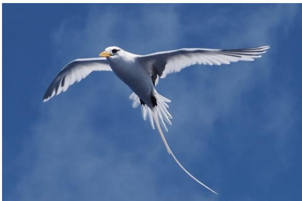
Bermuda Longtails begleiten uns

Fünfter Tag auf See: das Etmal von 131 Seemeilen ist sehr erfreulich. Morgens ist Bergfest: die Hälfte der Strecke ist geschafft. Wir haben noch 430 Seemeilen vor uns. Nach den gleichförmigen und ereignislosen vergangenen Tagen wird heute einiges geboten. Die vorhergesagte Winddrehung von Südost auf Südwest erfordert das Schiften der Segel. Genua nach Steuerbord, ausgebaumte Fock nach Backbord. Dann kommt Westwind Bft 5 mit Regenschauern, also Genua weg, Ausbaumer weg, Groß mit erstem Reff. Dann schläft der Wind ein und lässt uns allein mit dem inzwischen zwei Meter Seegang. Segel weg, Motor an und ab geht die Schaukelei. Später dann wieder guter Südsüdwestwind, Passatbesege lung setzen, bis er wieder einschläft und wir ab 20.00 Uhr den Motor starten und torkelnd durch die Nacht dröhnen. Zwischendurch verputzen wir den Rest Chili con Carne.