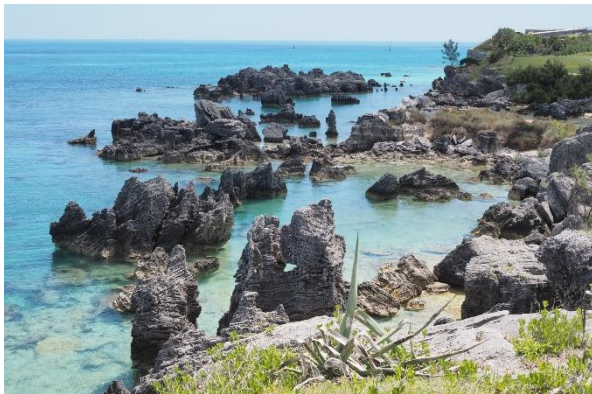
Die Nordküste von St. George's