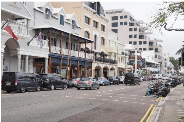
Die Hauptstadt Hamilton