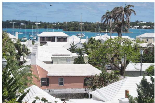
Die weißen Dächer von Bermuda