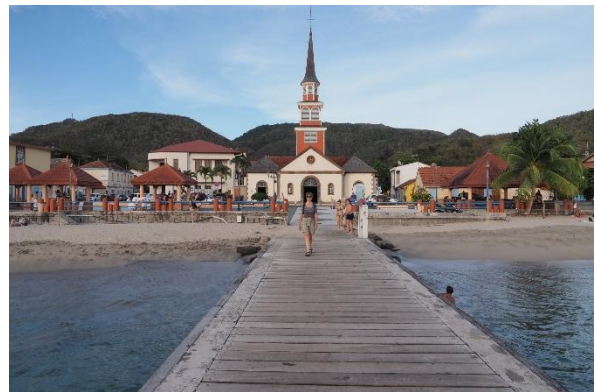
Die Kirche von Les Anses d'Arlet