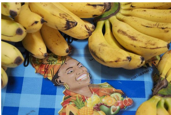
Auf dem Markt