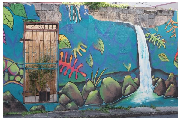
So werden Ruinenwände schöner

Es geht weiter nach Norden. Von Portsmouth hatten wir viel Gutes gehört: die PAYS-Kooperative* würde sich von der Hilfe an der Mooringtonne bis zur Vermittlung von Landausflügen um alles kümmern. Nun, da waren wir wohl die Ausnahme. Auf UKW antwortet niemand, keine einzige Mooringtonne ist frei und wir suchen uns einen guten Ankerplatz auf drei Meter tiefem Sandboden. Aber ich will den PAYS Jungs nichts schlechtes nachsagen, wir hatten nur einen schlechten Start. Die von ihnen zweimal wöchentlich organisierten Barbecues (All-you-can-eat und Rumpunsch satt bei guter Musik und Tanz) sind großartig. Das sollte niemand verpassen.