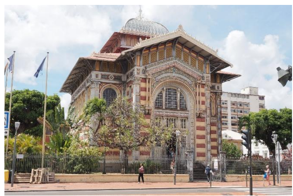
Die Schoelcher Bibliothek