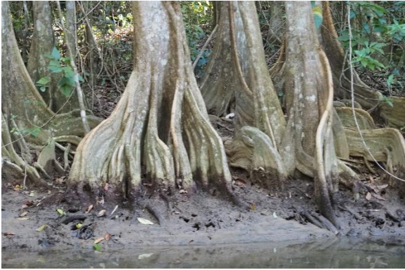
Am Indian River