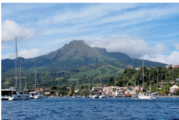
Der Montagne Pelée, selten fast wolkenfrei