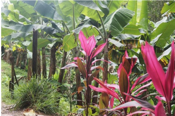
Im Urwald Guadeloupes

Wir unternehmen Ausflüge in den beeindruckenden Dschungel von Guadeloupe, mit Wasserfällen, gewaltigen Baumriesen und einem schier undurchdringlichen Gewirr von Farnen, Schlingpflanzen, wilden Bananen und bunten Blüten.