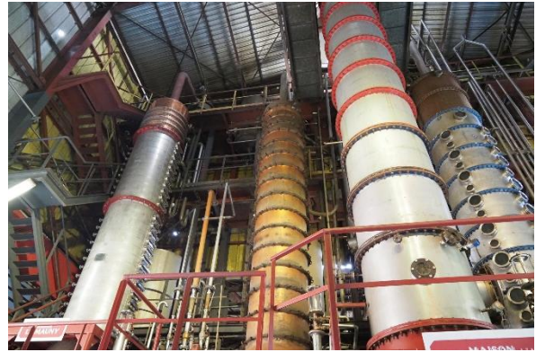
Die Rum-Destille „La Mauny“

Die erste Segelstrecke ist kurz. Wir segeln aus der Bucht von Le Marin heraus bis zur Grande Anse d'Arlet, einer sehr schönen Ankerbucht im Südwesten Martiniques.