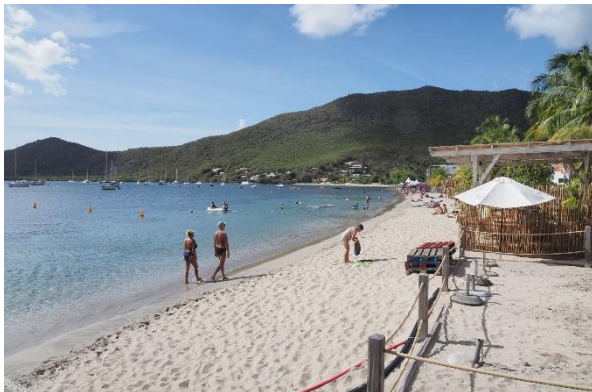
Grande Anse d'Arlet

Die erste Segelstrecke ist kurz. Wir segeln aus der Bucht von Le Marin heraus bis zur Grande Anse d'Arlet, einer sehr schönen Ankerbucht im Südwesten Martiniques.