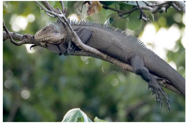
Ein Leguan sitzt träge auf einem Ast

Wir segeln weiter nach Terre de Haut, der zweitgrößten Insel der Iles des Saints. Hier liegen wir wieder an einer Mooringtonne, dicht am Dinghysteg des Dorfes. Um die Insel zu erkunden, mieten wir eines dieser Elektro-Autos, die wie Golfcaddys aussehen. So gelangen wir auch zur Anse Craven, wo wir einen herrlichen Schnorchelgrund erleben.