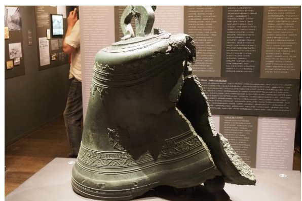
Die geschmolzene Glocke der Kirche von St. Pierre

Vor der Weiterfahrt nach Dominika steht die Online-Ausklarierung an. Die französischen Inseln schließen sich leider nicht dem Sailclear-Verfahren an, das fast alle Staaten der kleinen Antillen einheitlich verwenden. Das wäre zu einfach. So muss man eben den französischen Fragebogen online ausfüllen. Trotz des erforderlichen Kontos, das alle Daten enthält, wird jedes Mal aufs Neue jedes Detail des Schiffes abgefragt (Länge, Breite, Tiefgang, Verdrängung, wie viele