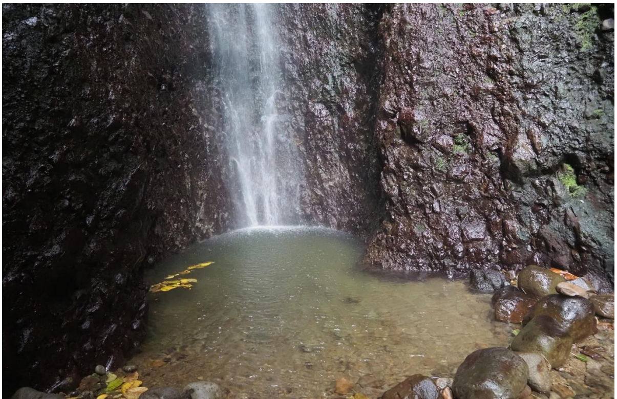
Einer der vielen Wasserfälle auf Basse-Terre