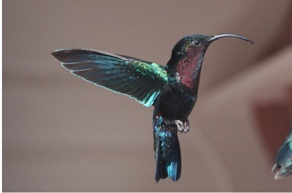
Kolibri im Botanischen Garten