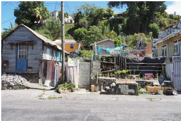
Roseau, Hauptstadt von Dominika