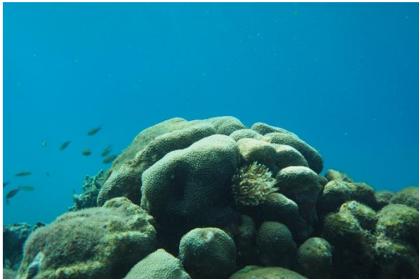
Im Marine Reserve Jaque Cousteau...