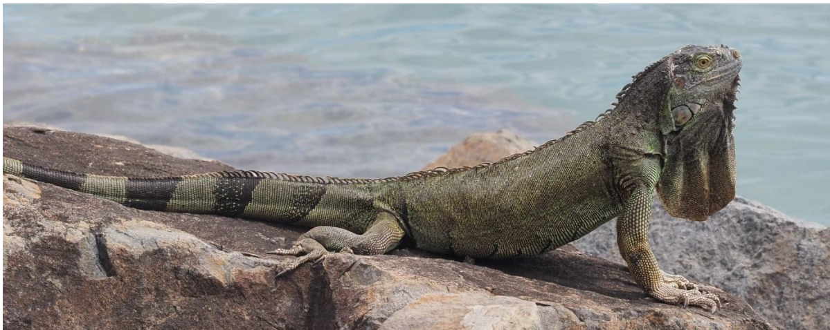
Leguan am Strand

Unser nächster Hafen St. Barths bietet nur einen recht unruhigen Ankerplatz und die Marina ist eher Schickimicki als charaktvoller Hafen. Das Einklarieren ist wieder etwas Besonderes. Das umständliche französische Verfahren von Martinique und Guadeloupe gilt hier nicht, zwar wird St. Barth von Guadeloupe verwaltet, man gönnt sich aber hier ein eigenes Verfahren. Die vorher online ausgefüllten Dokumente sind wertlos. Man pflegt hier ein System, das von der Benutzeroberfläche her den Eindruck vermittelt, es handele sich um eine Hausarbeit eines Informatikstudenten im ersten Semester.