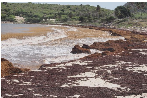
Die Ostseite der Inseln leiden unter dem Sargassogras

Es offenbaren sich auch die Schattenseiten der Inseln, nicht nur auf Antigua. Die Belastung durch Sargassogras und durch Müll.