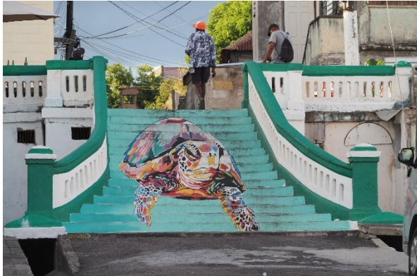
Treppe in Basseterre, St. Kitts