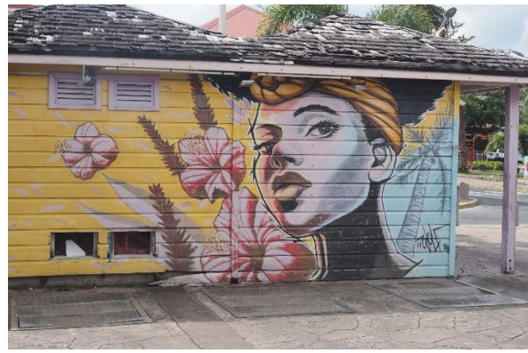
Kunstvolle Grafitti in Marigot, St. Martin

Von St. Barth ist es nur noch ein kleines Stück bis St. Martin. Hier gehen wir für drei Nächte in die Marina Fort St. Louis, modern, weitläufig, teuer und mit einer einzigen Herrendusche ausgestattet. Aber für das Bunkern von Diesel und Wasser sowie für die Einkäufe des Proviants ist ein Hafensplatz besser als ein Ankerplatz, wo alles mit den Dinghy hingeschafft werden muss. Auch Motorwartung und Rigg-Check ist einfacher im Hafen.