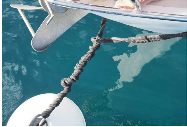
Kneuel an der Mooringboje

Der Wind an der Westküste von Guadeloupe dreht mehrmals täglich. Durch Landeffekte (quasi Mikro-Monsun) setzt am frühen Nachmittag West- bis Nordwestwind ein, der gegen Abend wieder einschläft. Das hat zur Folge, dass unsere zwei Festmacher an der Boje zu einer festen Wurst aufgedreht werden.