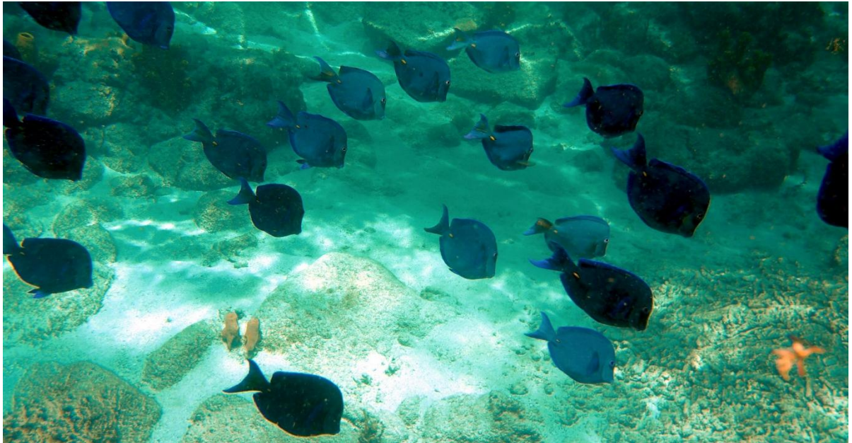
Schwärme bunter Fische, überall

Wir segeln ein weiteres kleines Stück nordwärts in die Bucht von Deshaies (gesprochen: daye. Ich verstehe nicht, warum die französische Schrift so viele Buchstaben verwendet, von denen kaum einer für die Aussprache genutzt wird). Auch Deshaies ist ein Paradies für Schnorchler. Ich sehe Schildkröten, einen Barrakuda, unzählige bunte Riffische, Schwämme und Korallen, aber eben leider auch Autoreifen und Getränkedosen. Exponate der Wegwerfgesellschaft.