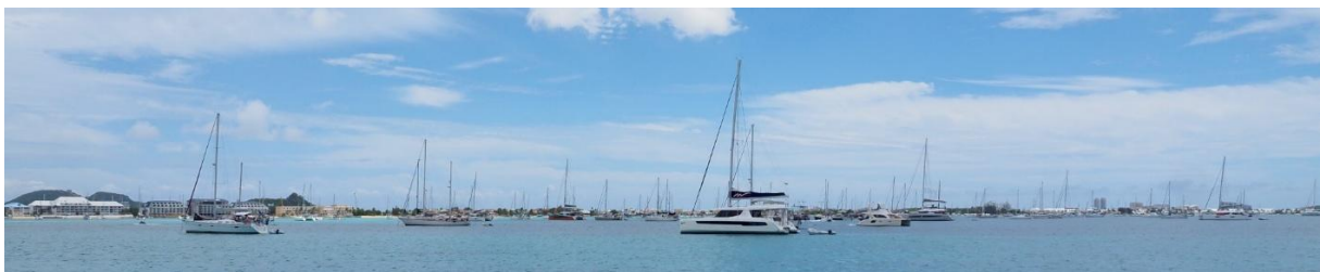
Mehr als hundert Yachten sammeln sich vor St. Martin für die Überfahrt

Jeweils mittwochs gibt es ein Treffen für Segler, die West-Ost über den Atlantik wollen. Die nette Runde schafft einige neue Bekanntschaften und frischt bestehende auf. Es liegen sehr viele Yachten in der Bucht, die alle auf ein günstiges Wetterfenster warten, um nach Bermuda oder direkt zu den Azoren zu segeln. Für das kommende Wochenende sieht die Wetterprognose recht gut aus. Ich klariere aus und fertige die Arrival Notification für Bermuda online aus. Morgen, am ersten Mai, wollen wir starten.