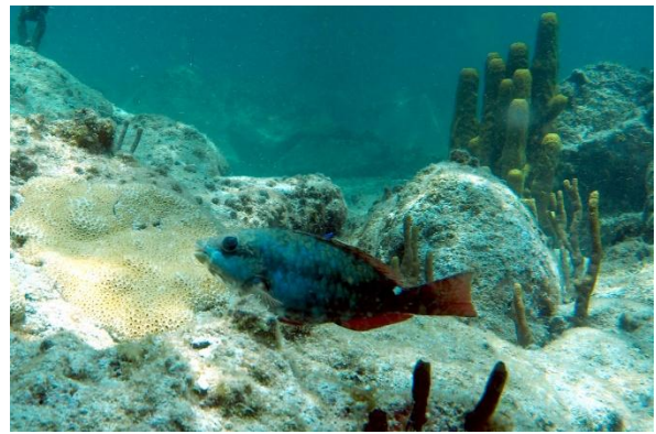
...wirkt die Unterwasserwelt noch halbwegs intakt