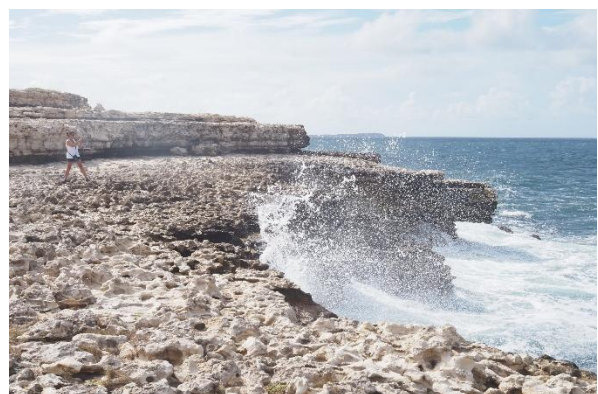
Devil's Bridge im Norden Antiguas