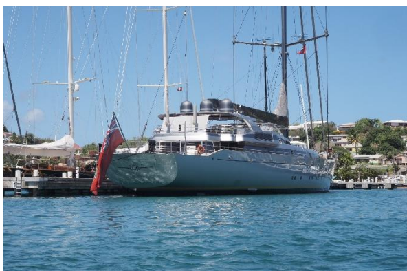
Die M5, größte einmastige Yacht der Welt