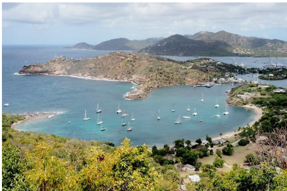
Blick von Shirley's Heights auf Freeman's Bay

Aber English Harbour bietet gerade jetzt zur Antigua Sailing Week sehr schöne traditionelle Yachten.