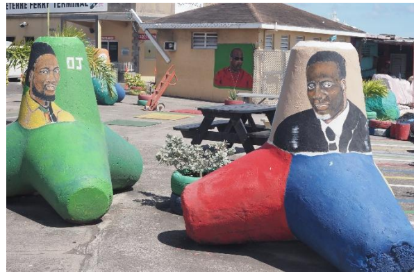
Basseterre, Idole in Öl und Beton