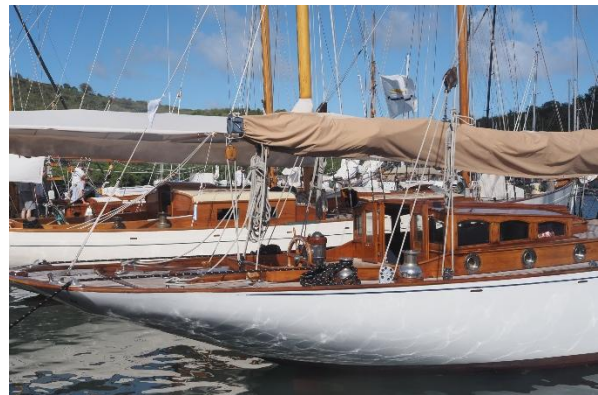
Klassische Yachten an Nelson's Dockyard, English Harbour