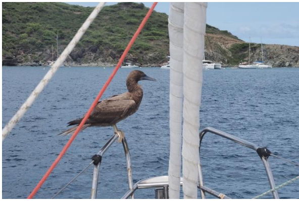
Begleitung in die Anse Colombier